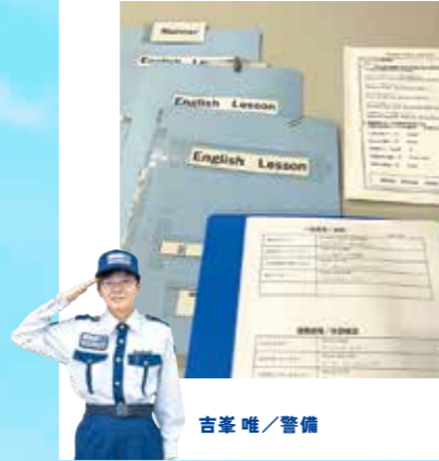
吉峯 唯 / 警備