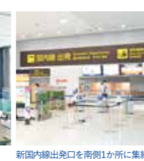
新国内線出入口を南側1か所に集約