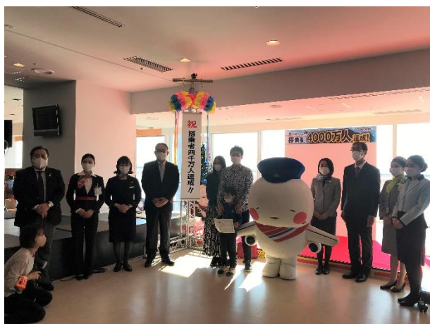
（写真：前回 4000 万人達成記念セレモニーの様子）