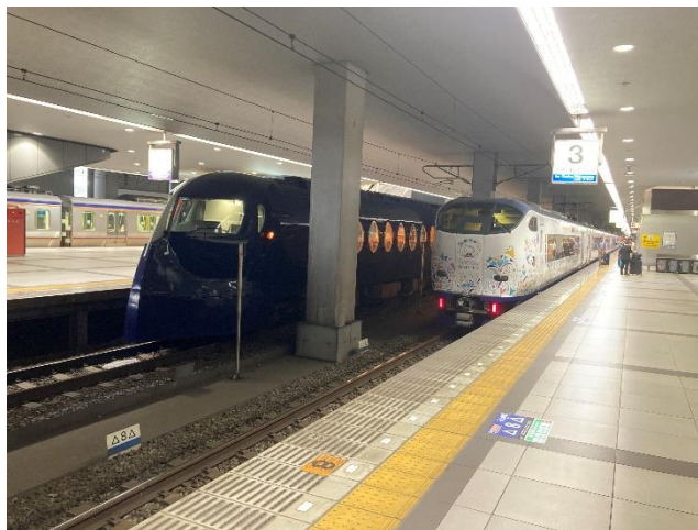
「ラピート」・「はるか」が並ぶフォトセッション会場イメージ

ホームへの入場には、入場券または乗車券等が必要です。 また、混雑の状況により入場を制限する場合があります。