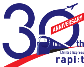
特急「ラピート」運行開始 30 周年記念ロゴ