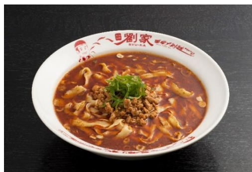
おすすめ商品：西安麻辣刀削麺