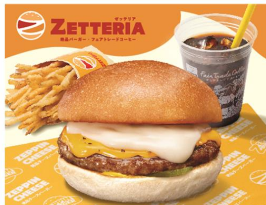
おすすめ商品：絶品チーズバーガー