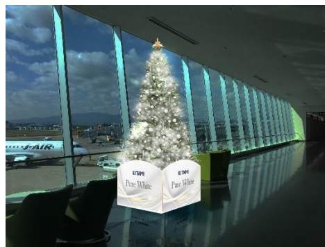
連絡通路（13・14番ゲート付近）