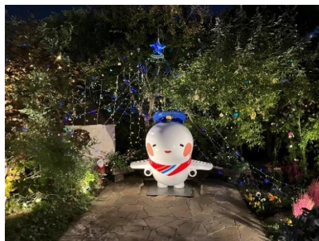
そらやんのおにわ