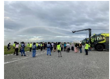
昨年の滑走路ウォークの様子