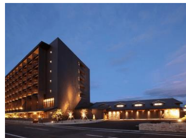
特賞 函館・湯の川温泉 ホテル万惣宿泊券 （1泊2食付／50,000円分）