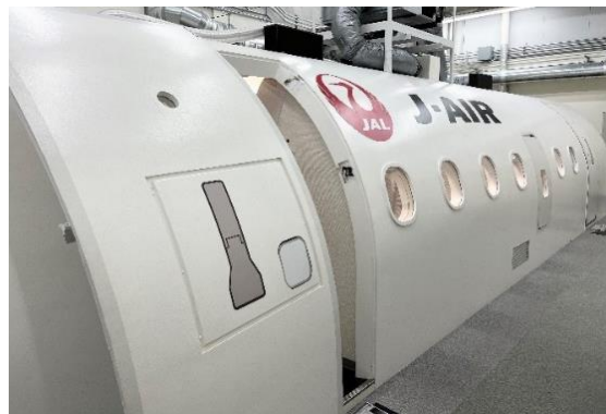
J-AIR訓練施設(イメージ)