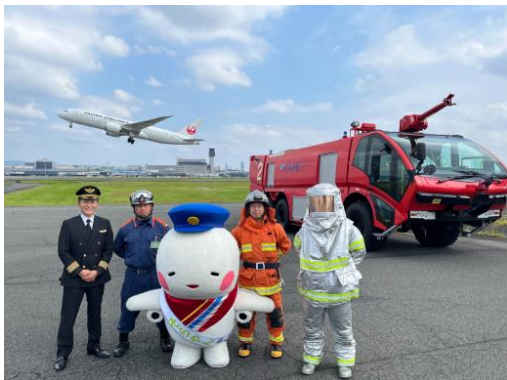
消防所見学での記念撮影(イメージ)

今回は、過去実施したツアーに参加したお客さまの声を踏まえ、お子さまから大人の方までより楽しんでいただけるように、12月10日(土)は航空ファン向け、12月11日(日)はお子さま向けの内容となっています。