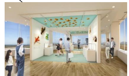
展示室①「空港や飛行機を見立てたミニチュアの世界」