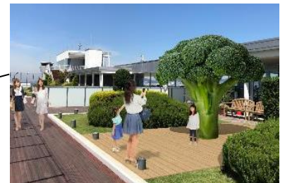
ブロッコリーの大型オブジェ