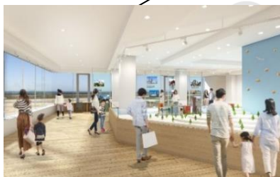
展示室②「神戸の町並みを見立ての世界で表現した世界」