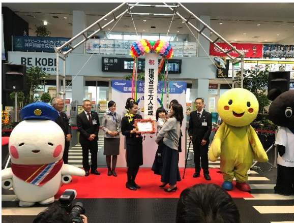
（写真：前回 3000 万人達成記念セレモニーの様子）

協 力：スカイマーク株式会社、全日本空輸株式会社、株式会社ソラシドエア、株式会社 AIRDO、株式会社フジドリームエアラインズ（順不同）