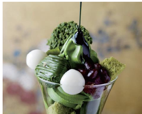
※パース、写真はイメージ