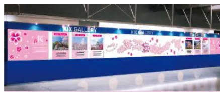
KIXギャラリー（イメージ）