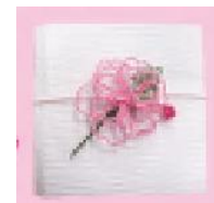
水引（参加型ワークショップ）