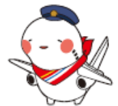
大阪国際空港マスコットキャラクター 「そらやん」とコラボレーション！