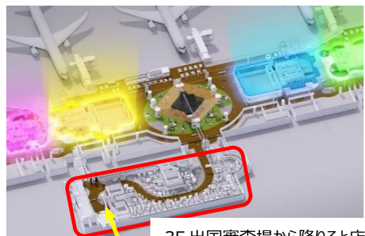
3F 出国審査場から降りると店内入口