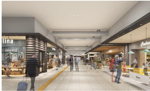
新規出店店舗 イメージ

関西エアポートグループは、これからも関係の皆様と連携し、国内外のお客さまを迎える関西地域のゲートウェイである関西国際空港の機能強化に向けて、安全・安心を第一にリノベーション工事を進めてまいります。