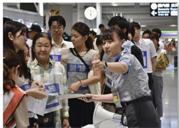
昨年の旅客対応訓練の様子