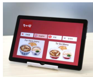
タッチパネル端末