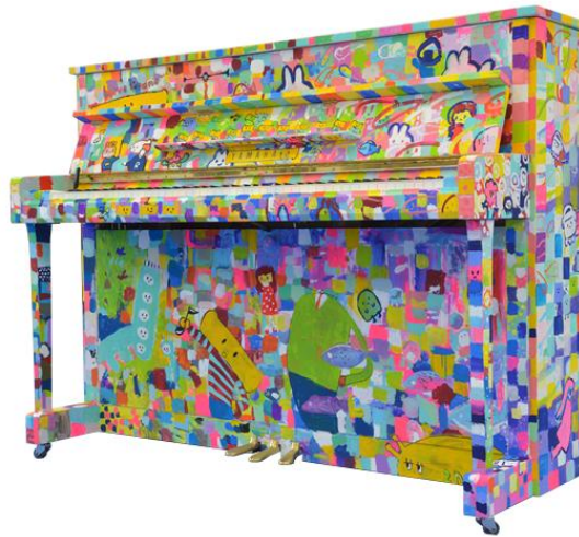
カラフルな塗装を施したヤマハのアップライトピアノ 愛称“LovePiano”

関西エアポート株式会社は、4月18日（木）～21日（日）の4日間、大阪国際空港（伊丹空港）内の北ターミナル4階展望デッキ入口に、誰でも気軽に弾くことができるペイントピアノ（愛称“LovePiano”、株式会社ヤマハミュージックジャパン提供）を設置します。それに先立ち、4月13日（土）～17日（水）まで、中央ブロック3階のDEAN&DELUCA CAFE前で“LovePiano”の展示を行います。空港での“LovePiano”の設置・展示は今回が初めてとなります。