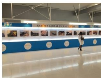
(付帯展開) KIXギャラリー 「KIXから行きたい中国の絶景」