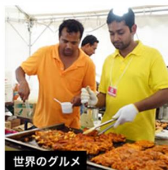
食べることはその国の文化を知ること！料理で海外気分を味わおう！