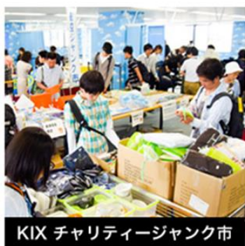
ここでしか手に入らない！レア航空関連グッズも多数取り揃え！