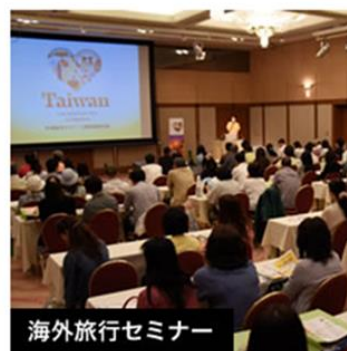
より深く！海外旅行の情報を知りたい方には超オススメです！