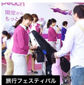
世界各国の出展ブースからあなたのお気に入りの国を見つけて下さい！

>>定番コンテンツ ※KIX チャリティージャンク市は前々回より展望ホールでの開催となっております。