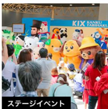
有名アーティストからゆるキャライベントまで多彩なステージで盛り上がるよ！